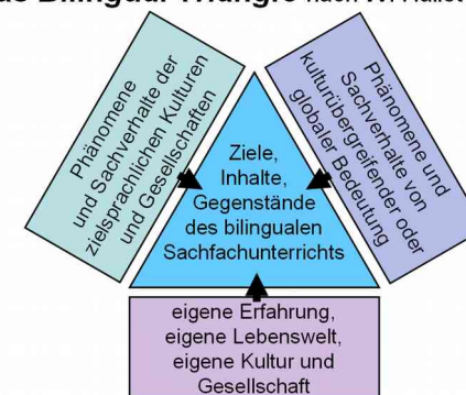
Das Bilingual Triangle nach W. Hallet (1998)