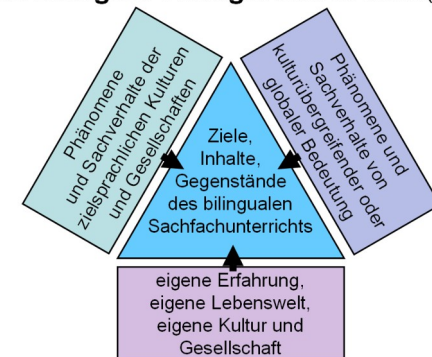
Das Bilingual Triangle nach W. Hallet (1998)